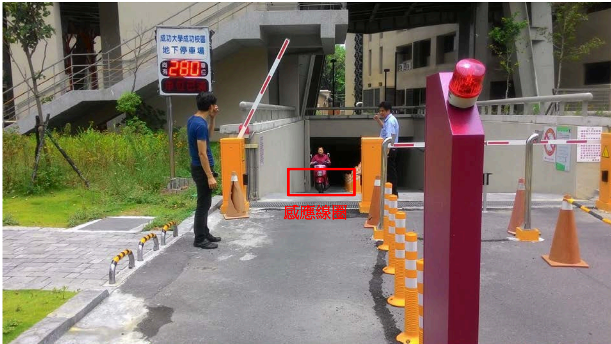
機車於出口處壓到地面感應線圈時駛離停車場