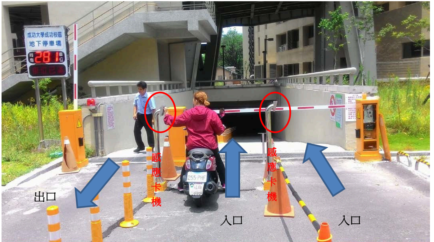
機車進入採刷卡進入